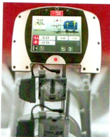
Рисунок 1 – Системы лазерные для измерения перемещений моделей Fixturlaser XA Pro, Fixturlaser XA Ultimate, Fixturlaser XA Geometry