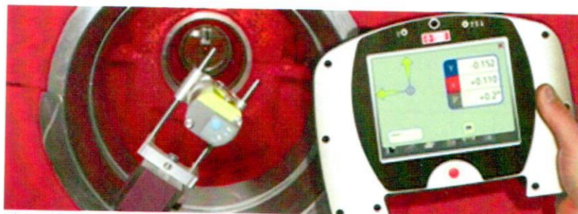
Рисунок 4 – Системы лазерные для выверки геометрии отверстий моделей Fixturlaser Bore Align ø80-600 XA XAD Base, Fixturlaser Bore Align ø80-600 XA XAD Full