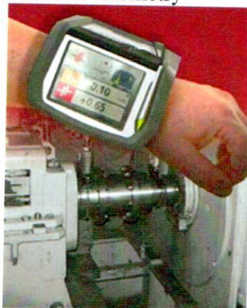
Рисунок 2 – Системы лазерные для измерения перемещений модели Fixturlaser Upad XA